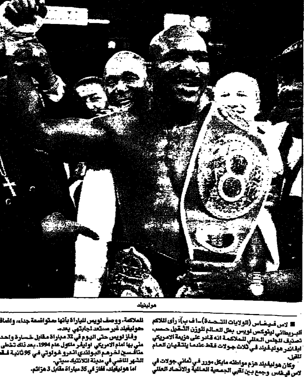
لويس آرمسترونغ يحتفل بالفوز في مباراته مع هوليفيلد...